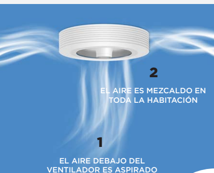
Efecto Vortex del ventilador

Las aletas Typhoon (amovibles) están integradas entre los álabes del ventilador y permiten aumentar la eficacia de la ventilación del 25% al 40%. El ventilador gira menos rápido y consume aún menos energía.