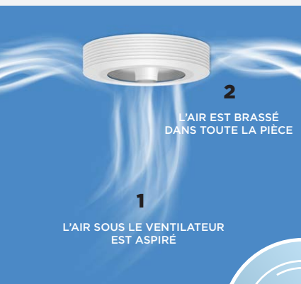
Effet Vortex du ventilateur